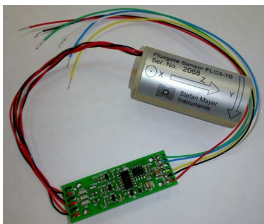
Плата электроники 50 x 18 мм

Диапазон измерений до \pm 200 мкТл, 0 Гц...1 кГц